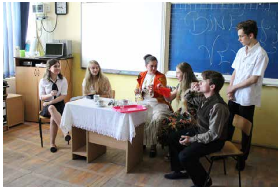
Spectacolul Gaițele — de Al. Kirișescu, 29.05.2016, Liebling