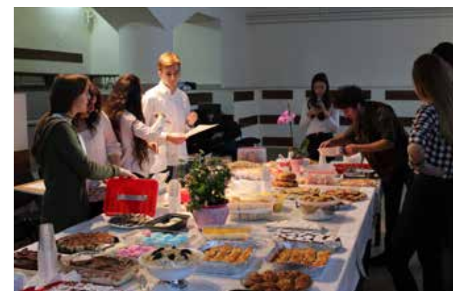
Istorie, film și gastronomie