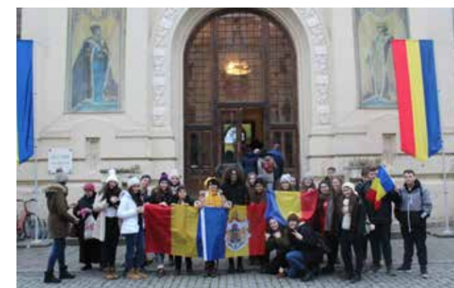
Alba Iulia - 1 decembrie 2017

Activitatea Consiliului Școlar al Elevilor din anul școlar 2017-2018 a debutat cu Concursul "Educația noastră cea de toate zilele" realizat de Ziua Internațională a Educației, 5 octombrie. Deja un concurs cunoscut în școala noastră, ediția de anul acesta nu a ezitat să ne surprindă. Elevii claselor a X-a s-au pregătit exemplar, iar reprezentanții clasei a X-a A au ieșit învingători.