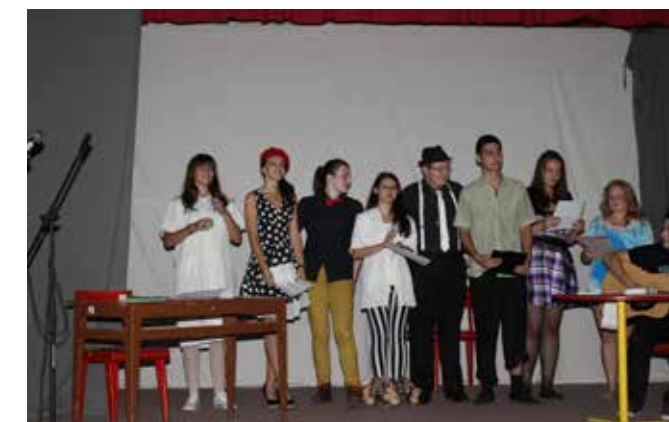
Exerciții de echilibru 2014