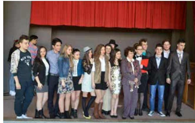
Începem Vârșeț 2015