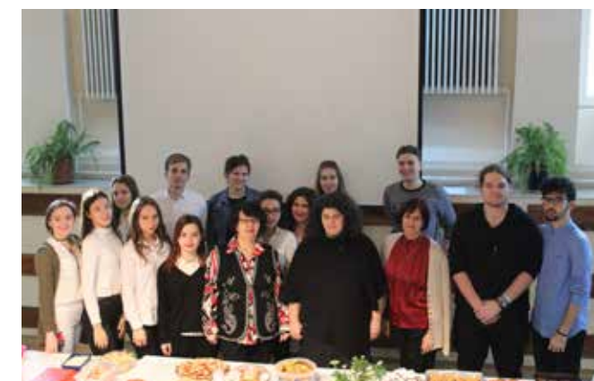
Istorie, film și gastronomie