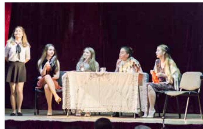
Gaițele 2016 (2)