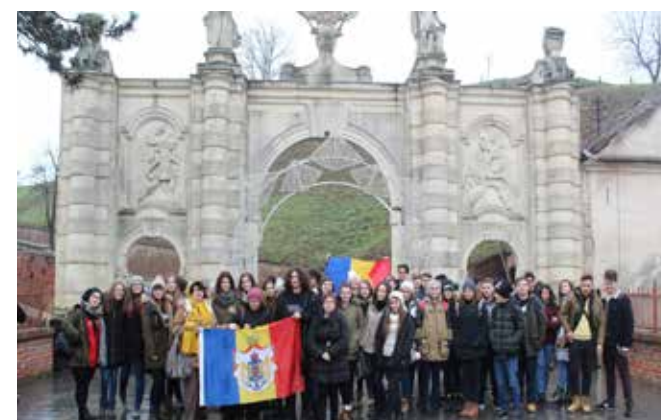
Alba Iulia - 1 decembrie 2017