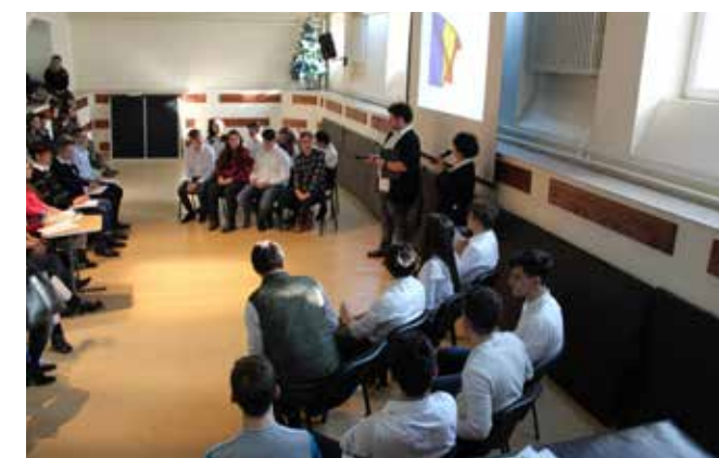
Concurs Unirea Principatelor Române