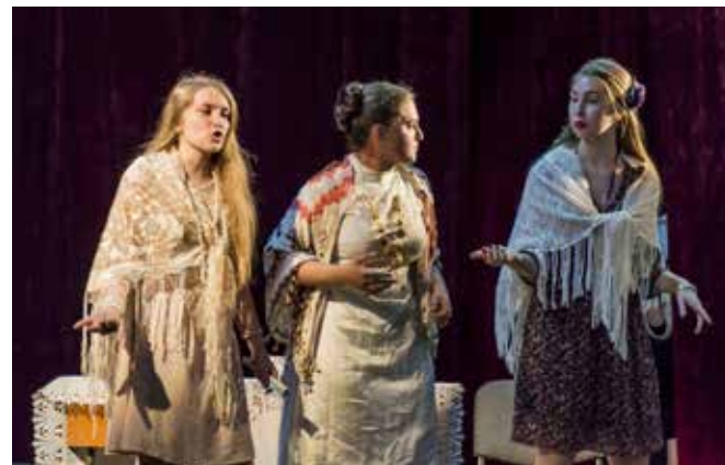
Gaițele 2016 (1)