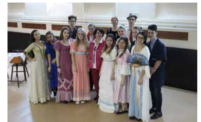
Doamna Ministru 2015