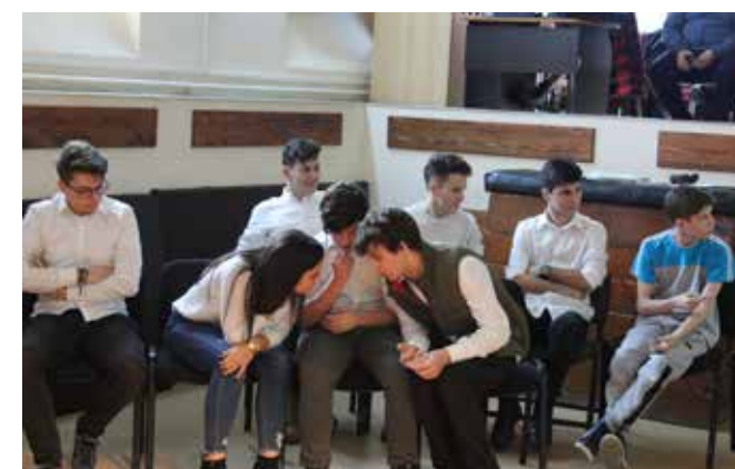
Concurs Unirea Principatelor Române

Proiectul cultural "Istorie, Film și Gastronomie" din 30 ianuarie 2018, a adus împreună trei mari arii culturale exprimate în titlul proiectului. Realizatorii au fost elevii claselor a IX-a B și a X-a A. Aceștia au pregătit preparate culinare delicioase pe care profesorii și membri juriului le-au apreciat cu diplome.