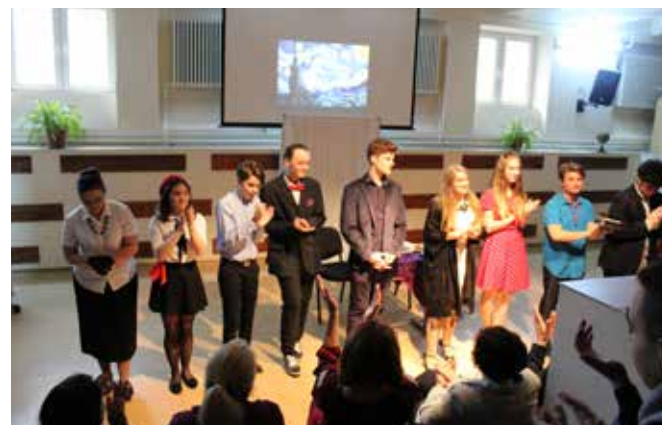
Steaua fără nume 2017