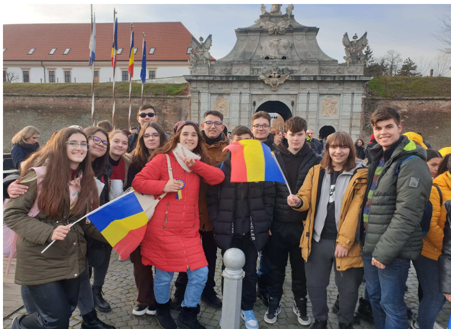
Celula lui Horia, Poarta a III-a a Cetății